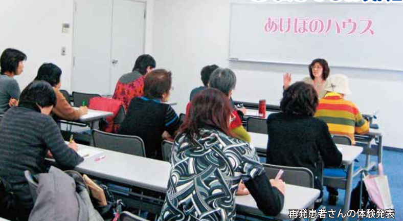
再発患者さんの体験発表